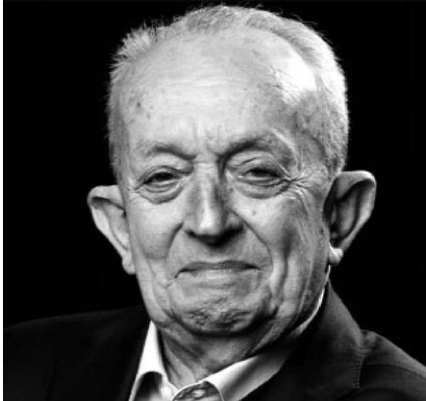
Tullio De Mauro

“Le parole per ferire” (Internazionale, 27-9-2016)